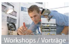
Workshops / Vorträge

Bitte beachten Sie, dass Tiere leider nicht in die Räumlichkeiten dürfen. Handys und Kameras schalten Sie bitte aus.