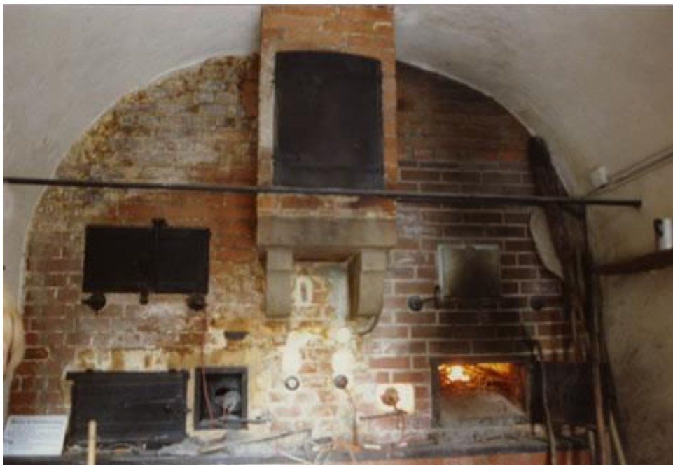
Innenansicht des Backhäusles.