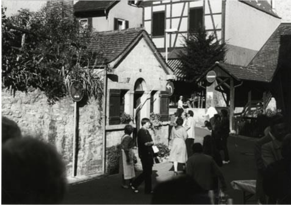
Das Backhäusle an der Fräuleinstraße findet reges Interesse.